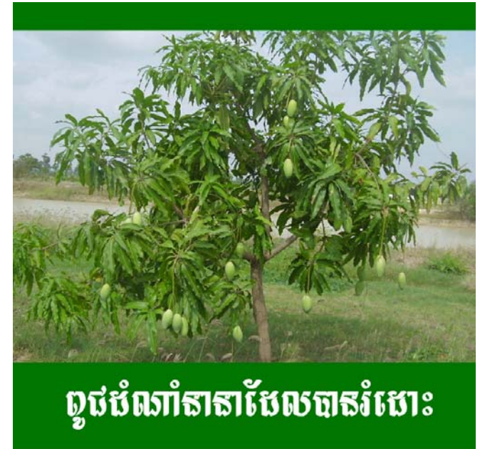
ពូជបំណាំនានាដែលបានរំដោះ

សម្រាប់ព័ត៌មានបន្ថែមសូមទាក់ទង ការិយាល័យរុក្ខជាតិស្រែសិប្ប ឬមជ្ឈមណ្ឌល បណ្តុះបណ្តាល និងព័ត៌មាន នៃវិទ្យាស្ថានស្រាវជ្រាវ និងអភិវឌ្ឍន៍កសិកម្មកម្ពុជា នៅតាម បណ្តាយផ្លូវជាតិលេខ៣ សង្កាត់ប្រទេសឡាង ខណ្ឌដង្កោ រាជធានីភ្នំពេញ ប្រអប់សំបុត្រលេខ ០១ ភ្នំពេញ ព្រះរាជាណាចក្រកម្ពុជា ទូរសារលេខ: (៨៥៥-២៣) ២១៩ ៨០០ ទូរស័ព្ទលេខ: (៨៥៥-២៣) ២១៩ ៦៩៣-៤ ទូរអគ្គី: PBREED@cardi.org.kh , TRIN@cardi.org.kh